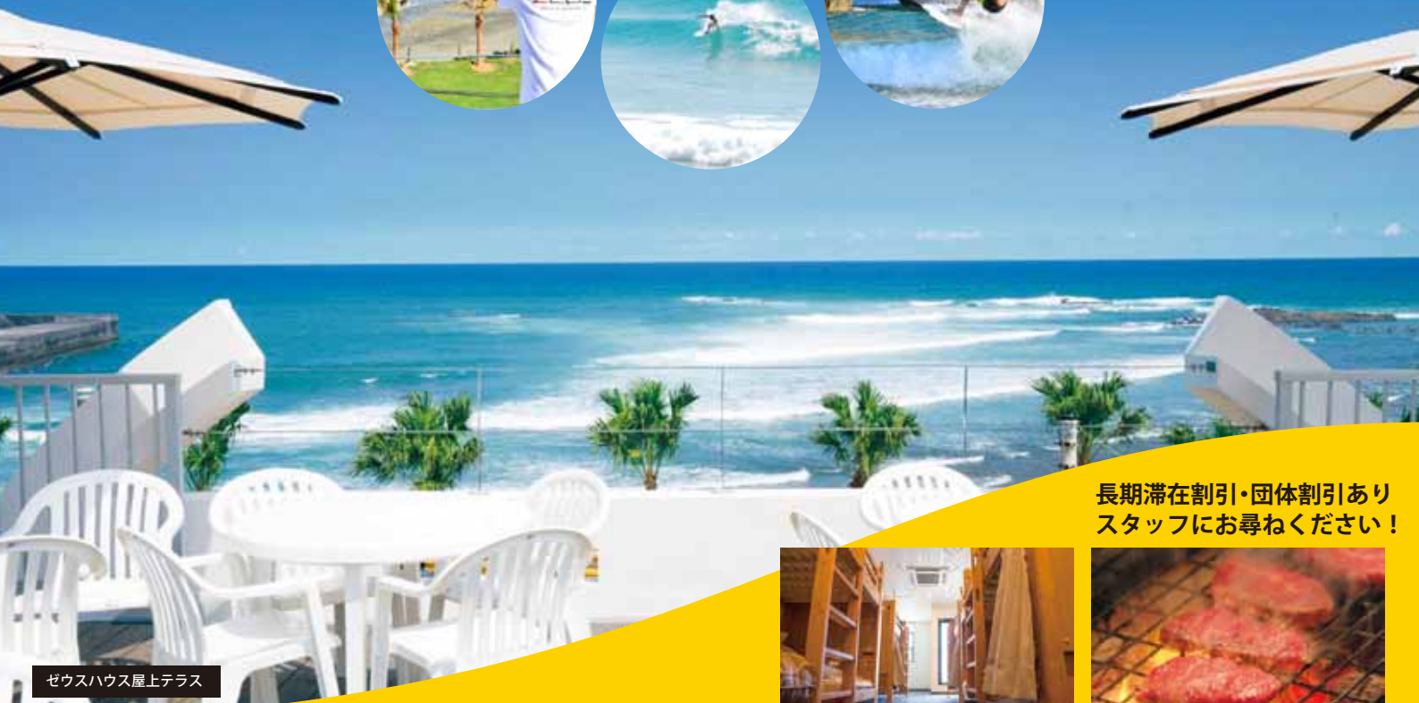
ゼウスハウス屋上テラス