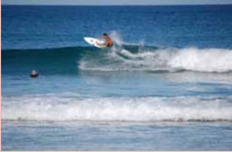
人の少ないサーフポイントへご案内

レベルにあわせたポイントへご案内、女性だけでも安心！ ドミトリで安く泊まって長期滞在！ グループでの参加大歓迎！