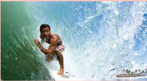
皆さんの旅をサポートする山口輝行プロ